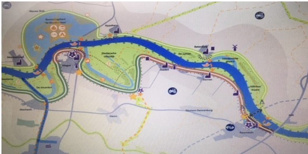
De Meanderende Maas; tussen Ravenstein, Batenburg en Megen

Landschappelijk gezien ontstaat er een zeer ruim natuurgebied met de Maas als centrum. Het grootste deel van het project ligt in en tegenover de gemeente Wijchen. Tegenover Balgoy ligt het natuurgebied De Keent, aan de Batenburgse kant De Liendense waard en De Lymen (ook gepland als natuurgebied). Aan de overkant van Batenburg liggen de uiterwaarden rond Demen, evenals de grote nieuwe meander De Diendense Uiterdijk, teruggegeven aan de natuur. Het wordt een aaneengesloten landschap dat met recht een Rivieren natuurpark wordt genoemd. De zorg waarmee dit landschap op een natuurlijke manier is "aangekleed" met aandacht voor zowel historie als functioneel gebruik is buitengewoon. En dat zal in schril contrast staan met willekeurige plaatsing van landschapsvreemde windturbines.