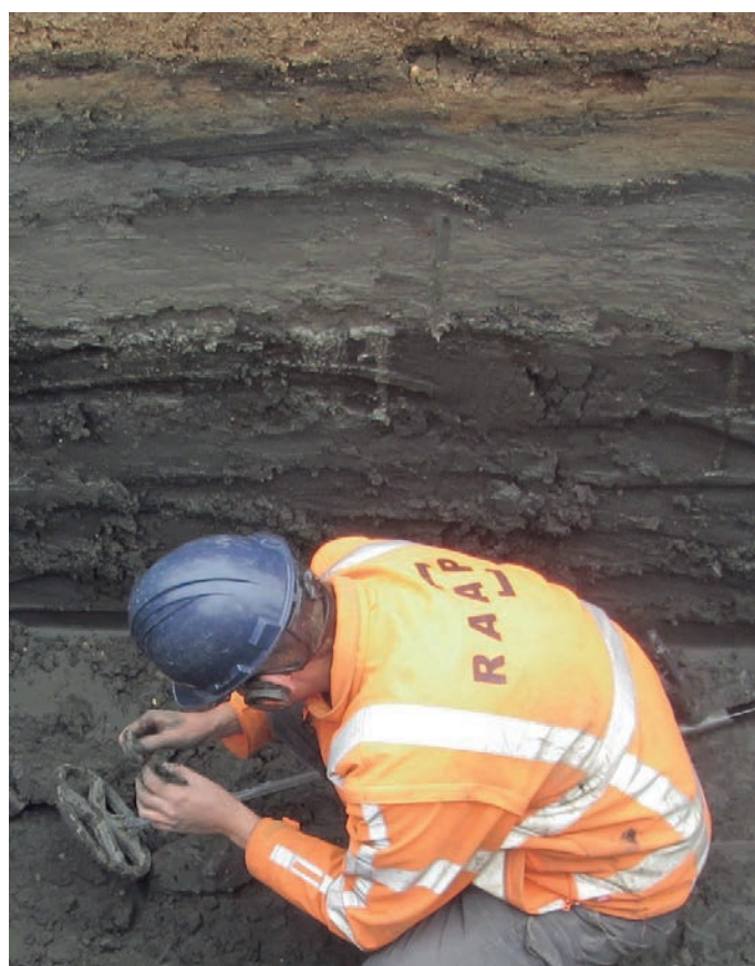
Archeoloog onderzoekt in de Kruisstraat de veenlaag die de oude Maasarm heeft opgevuld.