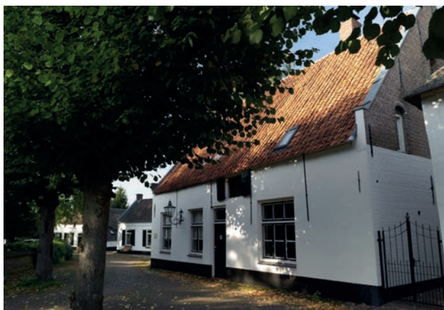
De Custerie aan het dorpsplein. Hier werden de sporen gevonden van een nederzetting uit de ijzertijd.

Al een jaar later, in 1389 betrok hij de burgers van Batenburg bij de (lagere) rechtspraak in de vorm van een