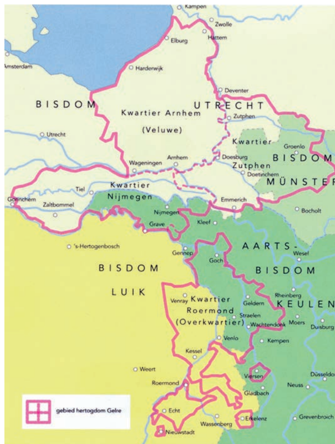
Het Hertogdom Gelre rond 1350. In de Middeleeuwen vielen de grenzen van hertogdommen en bisdommen niet samen.

Batenburg lag op een strategische plaats aan de Maas op de grens tussen de rivaliserende hertogdommen Gelre en Brabant. Ook Utrecht en Holland probeerden in die tijd invloed te verwerven in het rivierengebied. Een van de instrumenten die de rivaliserende landsheren gebruikten was het stichten van steden op strategische