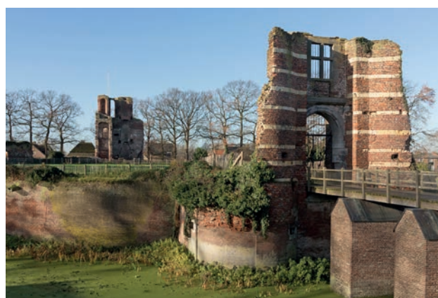
Resten van het poortgebouw en de Bronckhorster toren van het kasteel.