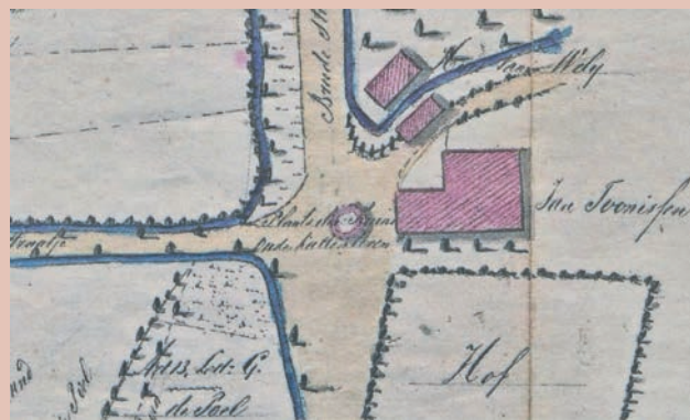
Ruïne van de Kattentoren op een kaart uit 1859. (Collectie Wil van den Dobbelsteen).

Tijdens de archeologisch begeleide graafwerkzaamheden voor het vervangen van het riool werd een deel van een rond fundament opgegraven op de hoek van de Stadswal en de Touwslagersbaan. Gezien de gebruikte stenen en het metselverband gaat het om een bouwwerk uit de 13e of begin 14e eeuw, waarschijnlijk een toren met een doorsnede van zes of zeven meter. Erg verassend was deze vondst eigenlijk niet, want al in de Geldersche Volksalmanak van 1839 en in verschillende publicaties daarna wordt verteld dat op die plek resten van een toren stonden die de Kattentoren werd genoemd. In 1859 werd op een tekeningen van kadastrale eigendommen de vindplaats aangekend als: 'Plaats der Ruïne Oude Kattentoren' en tot in het begin van de 20e eeuw zijn die muurresten nog zichtbaar gebleven en waren ze bij de bevolking algemeen bekend. Nu is het bestaan van de