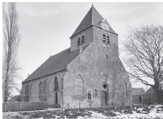
De oude Sint-Victorkerk in 1981 vóór de restauratie.

Binnen de kom van Batenburg is verder alleen naar het verleden gegraven tijdens de grondige restauratie van de oude Sint-Victorkerk. Die werd in 1982 uitgevoerd in opdracht van de Stichting Oude Gelderse Kerken. Dat onderzoek richtte zich vooral op de bouwgeschiedenis van de kerk. 2 Er is dan ook nauwelijks gegraven buiten de oude contouren van het gebouw, dat vroeger langer was dan nu. Rondom de kerk zijn zeker duizend jaar mensen begraven. Wat daarvan nog is terug te vinden is onbekend gebleven. Misschien is dat ook maar beter zo. Buiten de huidige kerk stond tot het bombardement door prins Maurits in 1600 een koor. Daarvan werd het oorspronkelijke fundament uit de late 11e eeuw teruggevonden. De kerk was toen een eenvoudige vroeg-romaanse zaalkerk van tufsteen. Batenburg moet in die tijd al wel een nederzetting van enige omvang zijn geweest. Waarom zou je anders een dergelijke kerk bouwen? Waarschijnlijk is het stenen gebouw zelfs een opvolger van een voorafgaande houten kerkje. Van een stad kan toen echter nog geen sprake zijn geweest.