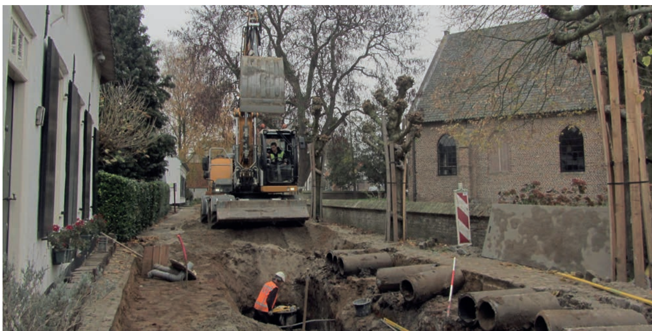
Graven in 'heilige' grond langs de kerkhofmuur van de oude Sint-Victorkerk.