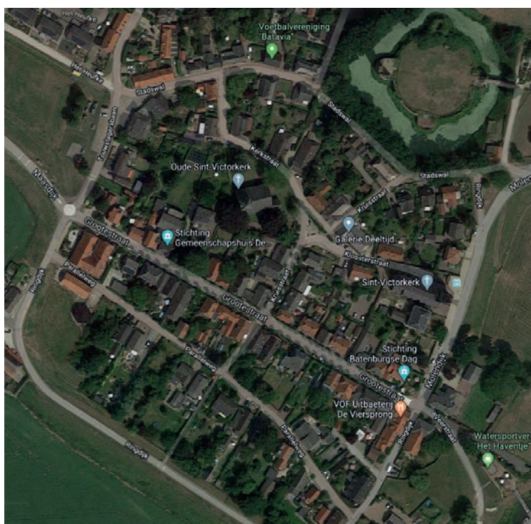
Kaart van Batenburg nu. (Bron Google maps).

Hemelsbreed amper vijf kilometer van Batenburg ligt nog een andere motte, die van Leur. 4 Vanuit het aartsbisdom Keulen was daar al vóór de 10e eeuw een zogenaamde 'oerparochie' gesticht. Die nederzetting, aan de noordoever van een toen nog stromende tak van de Maas, had in die tijd kennelijk al enige omvang