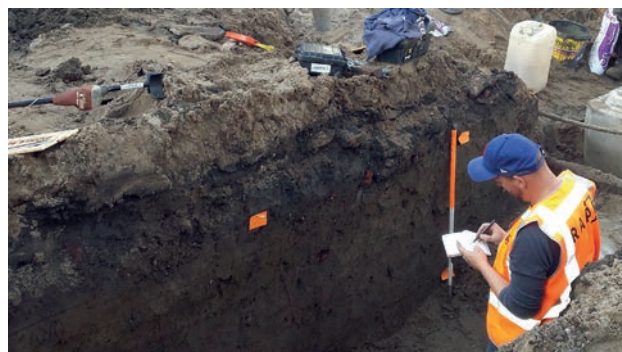
RAAP archeoloog aan het werk in de Kerkstraat.

Waar nu de Kruisstraat is werden in de (neven) geul van de Maas bewoningssporen gevonden vanaf de 11e eeuw. Sporen uit de Romeinse tijd en de vroege Middeleeuwen zijn niet aangetroffen. In de volle Middeleeuwen (1100-1300) was Batenburg niet groter dan van de huidige stadswal in het noorden tot de zuidkant van het huidige dorpsplein. De nederzetting werd in het oosten begrensd door de slotgracht van het hoger gelegen kasteel. Aan de zuidkant was het stroomgebied van de Maas, met bevaarbare geulen, ondoordringbaar oobos en moeras. In het noorden en westen was mogelijk een gracht die de kasteelgracht aan die kant met de Maas verbond. Mogelijk was daar ook of alleen een houten