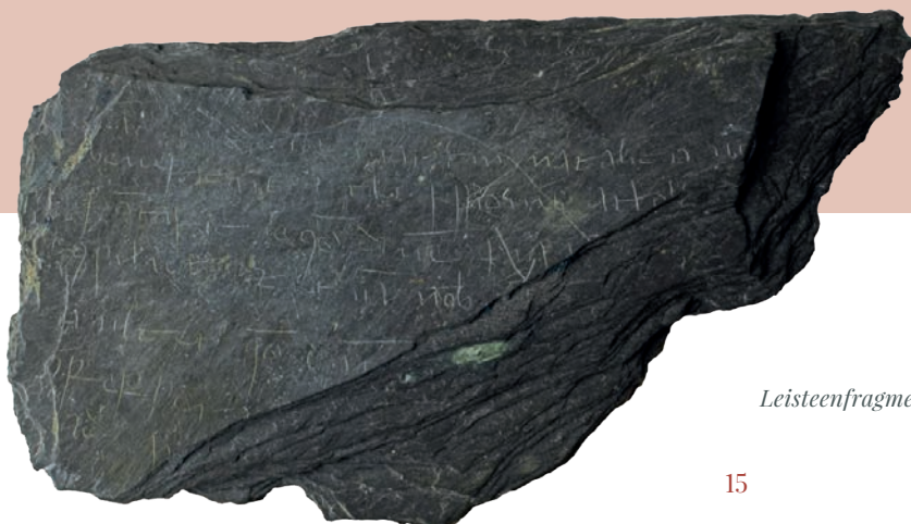
Leisteenfragment met Latijnse tekst op ware grootte.

In een door de gemeente Wijchen in samenwerking met RAAP in mei 2019 georganiseerde perspresentatie zou de ingekraste tekst een gebed zijn aan Sint-Maarten, die al vanaf de vroege middeleeuwen populair was en speciaal door soldaten werd vereerd. Het was toen (en is nu nog steeds) niet mogelijk om uitsluitel te geven over de precieze betekenis van de tekst.